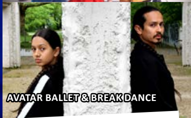
AVATAR BALLET & BREAK DANCE