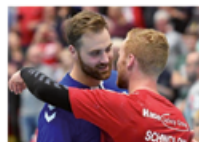
Handball-Nationaltorhüter Andreas Wolff übernimmt die Schirmherrschaft!