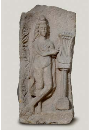
Reliefskulptur des Gottes Apoll aus einem römischen Steinbruch zwischen Obernburg und Wörth

Mit erweiterten Öffnungszeiten und aktuellem Hygiene-Konzept startet das Römermuseum Obernburg in die neue Saison 2020. Eine Museums-Rallye für Kinder lädt Familien zum Besuch ein.