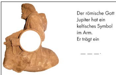
Der römische Gott Jupiter hat ein keltisches Symbol im Arm. Er trägt ein

in dem sich die Antike mit zahlreichen Elementen anfassen und begreifen lässt, vorerst nicht zugänglich.