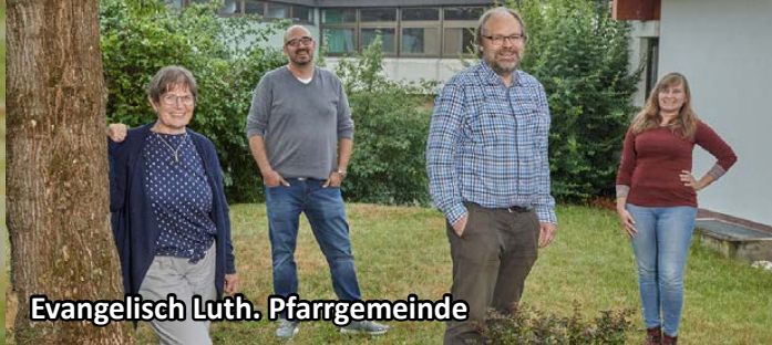
Evangelisch Luth. Pfarrgemeinde