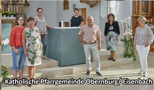
Katholische Pfarrgemeinde Obernburg/ Eisenbach