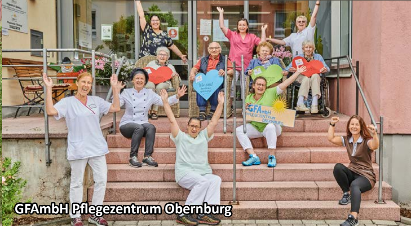
GFAmbH Pflegezentrum Obernburg