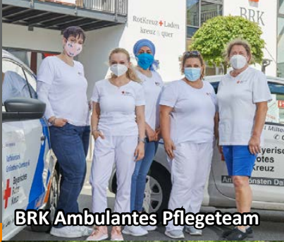
BRK Ambulantes Pflgeteam