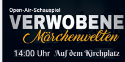
Open-Air-Schauspiel VERWOBENE Märchenwelten 14:00 Uhr Auf dem Kirchplatz