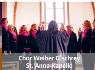
Chor Weiber G'schrey St. Anna-Kapelle