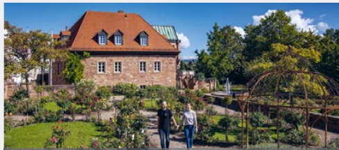
Ausstellung Malerei & Zeichnung – Kochsmühle