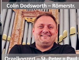
Orgelkonzert – St. Peter + Paul